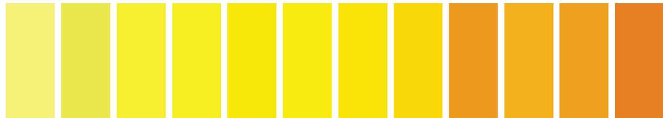
347 AA S ■ I Lemon Yellow Hue Nuance de Jaune Citron Aceite de Alazor 025 A S4 ■ Bismuth Yellow Jaune de Bismuth Amarillo Bismutot 722 A S2 □ II Winsor Lemon Jaune Citron Amarillo Winsor 086 A S4 ■ I Cadmium Lemon Jaune de Cadmium Citron Amarillo de Cadmio Claro 730 A S2 □ I Winsor Yellow Jaune Winsor Amarillo Winsor 653 A S4 □ I Transparent Yellow Jaune Transparente Amarillo Transparente 149 A S1 □ I Chrome Yellow Hue Nuance de Chrome Tono de Cromo Amarillo 118 A S4 ■ I Cadmium Yellow Pale Jaune de Cadmium Pâle Amarillo de Cadmio Pálido 108 A S4 ■ I Cadmium Yellow Jaune de Cadmium Amarillo de Cadmio 319 A S2 □ I Indian Yellow Jaune Indien Amarillo Indio 731 A S2 □ I Winsor Yellow Deep Jaune de Cadmium Foncé Amarillo Winsor Oscuro 111 A S4 ■ I Cadmium de Yellow Deep Jaune de Cadmium Foncé Amarillo de Cadmio Oscuro