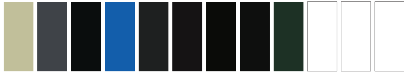
217 AA S2 □ I Davy's Gray Gris de Davy 465 AA S1 □ I Payne's Gray Gris de Payne 034 A S1 □ I Blue Black Noir de Vigne Negro de Vina 322 A S2 □ I Indigo Indigo 142 AA S1 □ I Charcoal Grey Gris de Fussain Gris de Carbón 386 AA S2 ■ Mars Black Noir de Mars Negro de Marte 331 AA S1 □ I Ivory Black Noir d'ivoire Negro de Marfil 337 AA S1 ■ Lamp Black Noir de Fumée Negro de Humo 505 A S1 □ Perylene Black Noir de Perylene Negro Perileno 242 AA S1 ■ Flake White Hue Nuance de Blanc De Plomb Tono de Blanco De Plomo 748 AA S1 ■ Zinc White Blanc de Zinc Blanco de Zinc 674 AA S1 ■ I Underpainting White (Fast Drying) Blanc de Sous-Couche (Séchage Rapide) Blanco Subcapa (Secado Rápido)