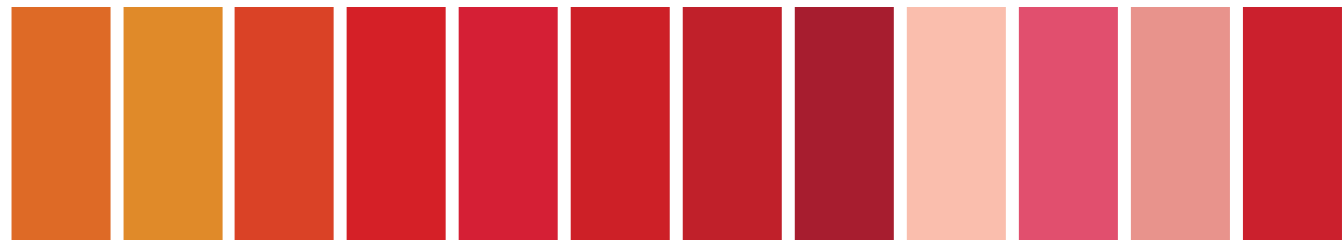
089 A S4 ■ I Cadmium Orange Orange de Cadmium Naranja de Cadmio 724 A S2 □ Winsor Orange Orange Winsor Naranja Winsor 106 A S4 ■ I Cadmium Scarlet Ecarlate de Cadmium Escarlata de Cadmio 603 A S2 □ Scarlet Lake Laque Escarlata Laca Escarlata 094 A S4 ■ I Cadmium Red Rouge de Cadmium Rojo de Cadmio 726 A S2 □ Winsor Red Rouge Winsor Rojo Winsor 725 A S2 □ I Winsor Red Deep Rouge Winsor Foncé Rojo Winsor Oscuro 097 A S4 ■ I Cadmium Red Deep Rouge de Cadmium Foncé Rojo Cadmio Oscuro 257 A S2 ■ I Flesh Tint Tinte Chair Tinte Carne 587 A S5 □ II Rose Madder Genuine Garance Rose Véritable Granza Rosa Genunia 576 A S5 □ II Rose Dore Rose Doré Rosa Dorado 042 A S1 □ Bright Red Rouge Vif Rojo Brillante