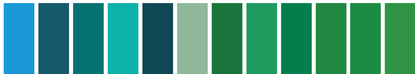
379 A S1 □ I Manganese Blue Hue Nuance de Bleu de Manganèse Tono de Azul Manganoso 526 A S1 □ I Phthalo Turquoise Turquoise de Phthalo Turqueso Ftalo 190 AA S5 ■ I Cobalt Turquoise Turquoise de Cobalt Turquesa de Cobalto 191 AA S4 ■ I Cobalt Turquoise Light Turquoise de Cobalt Clair Turquesa de Cobalto Claro 184 AA S5 □ I Cobalt Green Vert de Cobalt Verde de Cobalto 183 AA S4 ■ I Cobalt Chromite Green Vert de Chromite de Cobalt Verde Cobalto Cromado 147 A S1 ■ I Chrome Green Deep Hue Nuance de Vert de Chrome Foncé Tono de Verde Cromo Oscuro 692 AA S4 □ I Viridian Vert de Guignet Viridiano 720 A S2 □ I Winsor Green (Phthalo) Vert Winsor (Phthalo) Verde Winsor (Ftalo) 721 A S2 □ I Winsor Green (Yellow Shade) Vert Winsor (Nuance Jaune) Verde Winsor (Matiz Amarillo) 482 A S2 □ I Permanent Green Deep Vert Foncé Permanent Verde Oscuro Permanente 481 A S2 □ II Permanent Green Vert Permanent Verde Permanente