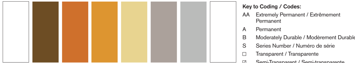
644 AA S1 ■ I Titanium White Blanc de Titane Blanco de Titano 058 A S2 □ Bronze Bronze Bronce 214 A S2 □ Copper Cuivre Cobre 573 A S2 □ Renaissance Gold Or Renaissance Oro Renacimiento 283 A S2 □ Gold Or Oro 511 A S2 □ Pewter Etain Peltre 617 A S2 □ Silver Argent Plata 330 A S1 □ Indescent White Blanco Nacré Blanco Iridescente

Key to Coding / Codes: AA Extremely Permanent / Extrêmement Permanent A Permanent B Moderately Durable / Modèremment Durable S Series Number / Numéro de série □ Transparent / Transparente □ Semi-Transparent / Semi-transparente ■ Semi-Opaque ■ Opaque