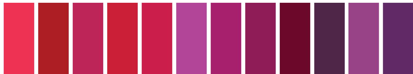
448 A S4 □ Quinacridone Red Rouge Quinacridone Rojo Quinacridona 004 B S2 □ Alizarin Crimson Alizarine Cramoisie Carmesi Alizarina 479 A S2 □ I Permanent Carmine Carmine Permanent 468 A S4 □ I Permanent Alizarin Crimson Alizarine Cramoisie Permanent Carmesi Alizarina Permanente 502 A □ I Permanent Rose Rosa Permanent 545 A S2 □ I Quinacridone Magenta Magenta Quinacridone Magenta Quinacridona 380 A S2 □ I Magenta Magenta 489 A S2 □ I Permanent Magenta Magenta Permanent 543 A S2 □ Purple Madder Garance Pourpre Purpura Granaçu 544 A S1 □ Purple Lake Laque Pourpre Laca Purpura 192 AA S5 □ I Cobalt Violet Violet de Cobalt 491 AA S4 □ I Permanent Mauve Mauve Permanent Malva Permanente